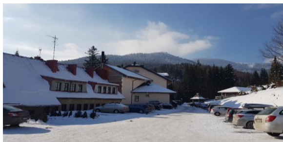
Fot. 1. OWT JONTEK – miejsce obrad XXXI Ogólnopolskiej Konferencji N-T „MKwPiAKH” Korbielów-2019.