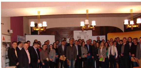
Fot. 2. Uczestnicy XXX Jubileuszowej Konferencji MKwPiAKH KORBIELÓW-2018.